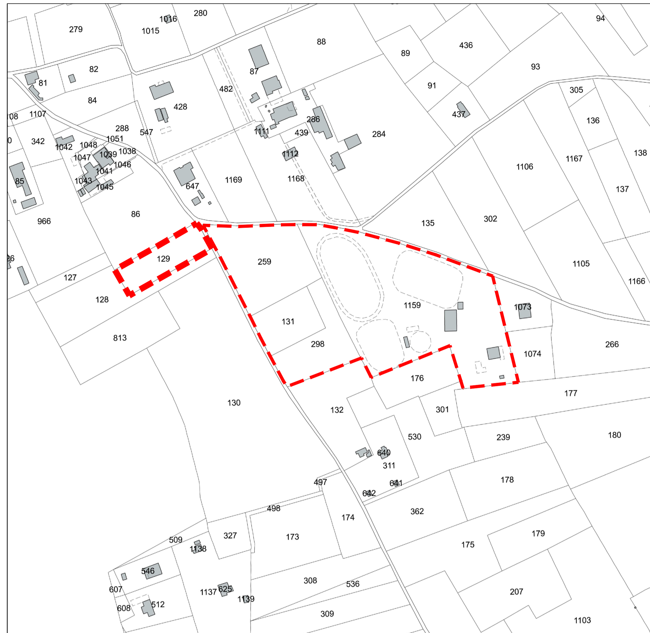
PLANIMETRIA CATASTALE scala 1:2000