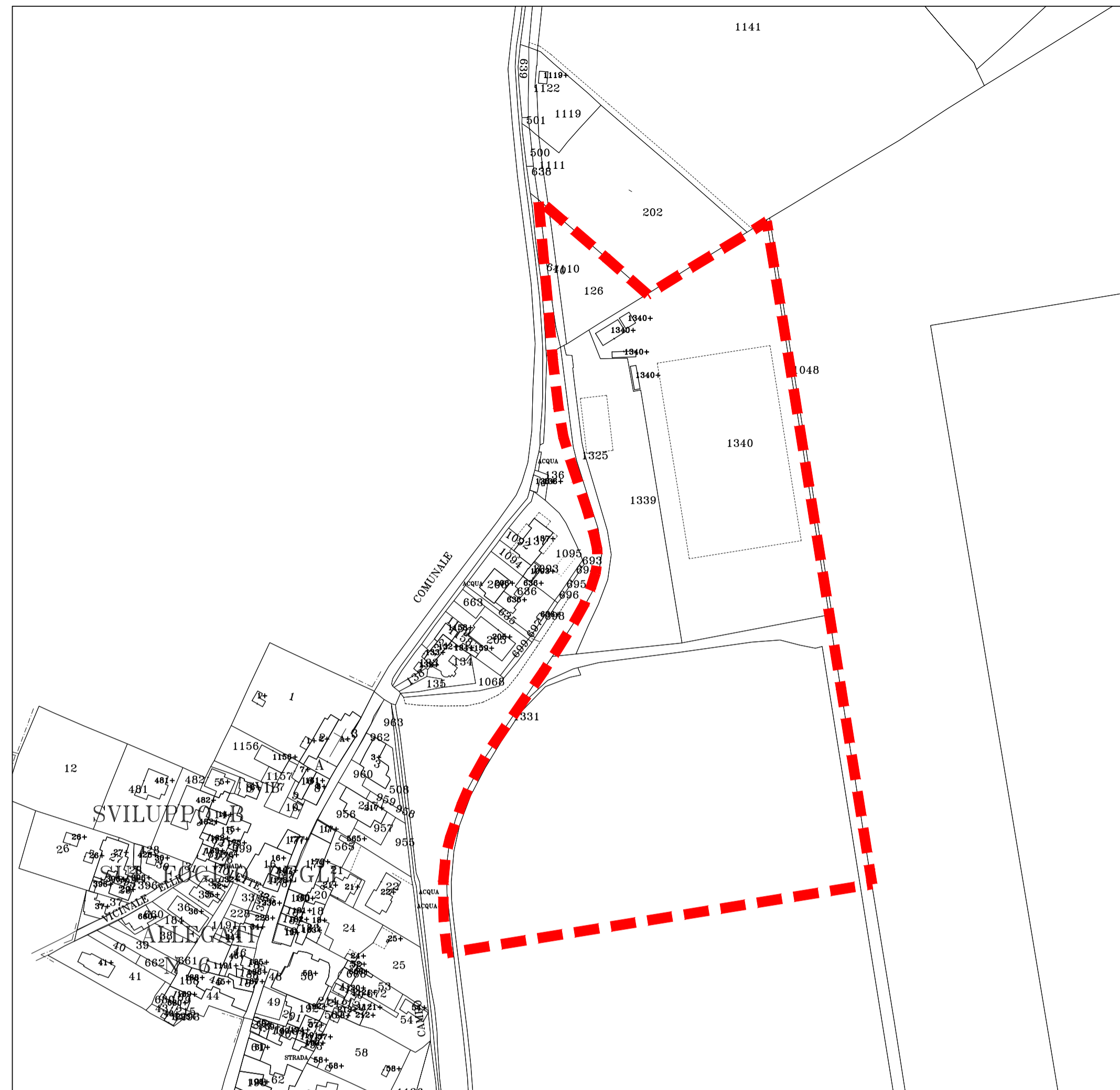
PLANIMETRIA CATASTALE scala 1:2000