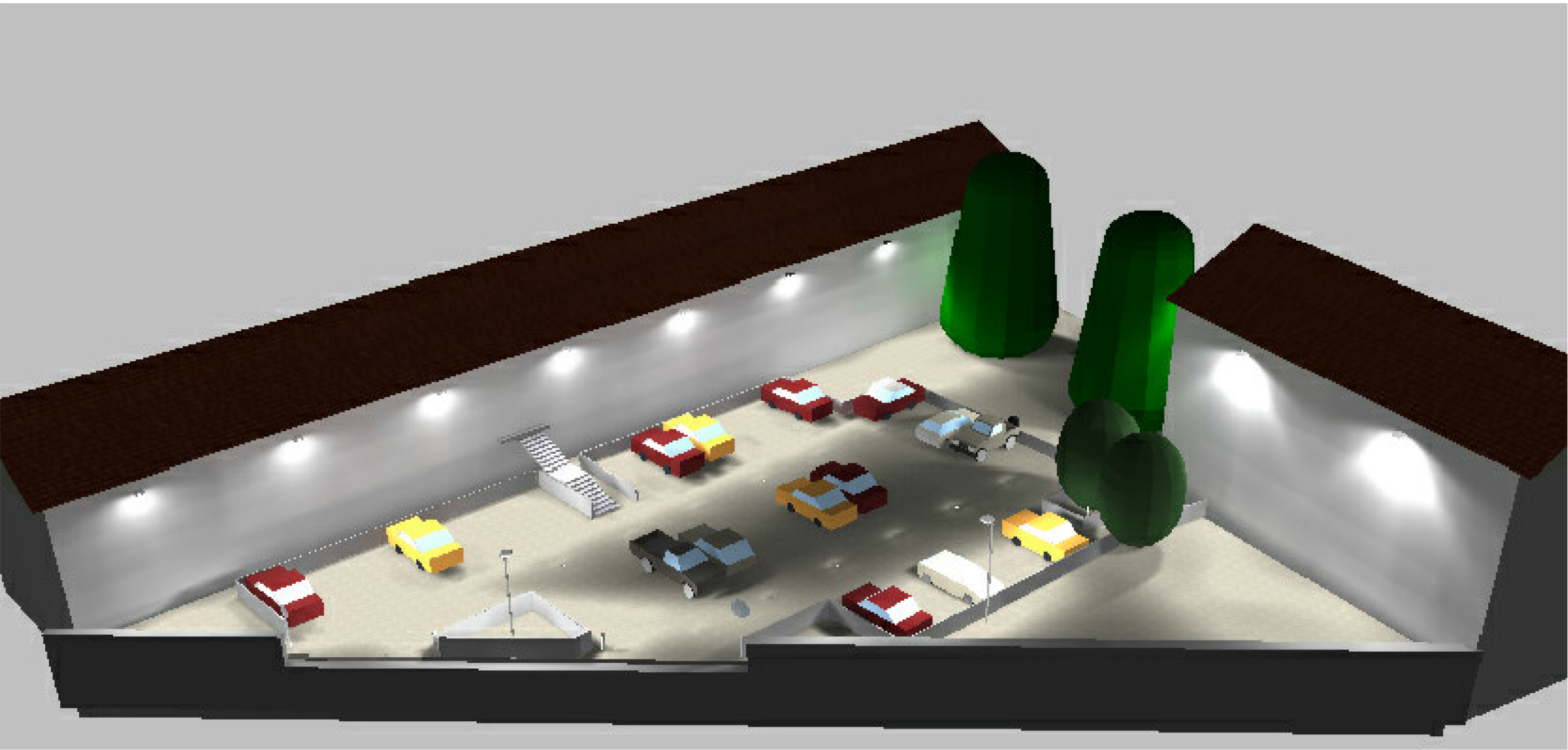
Verifica illuminotecnica - Dialux